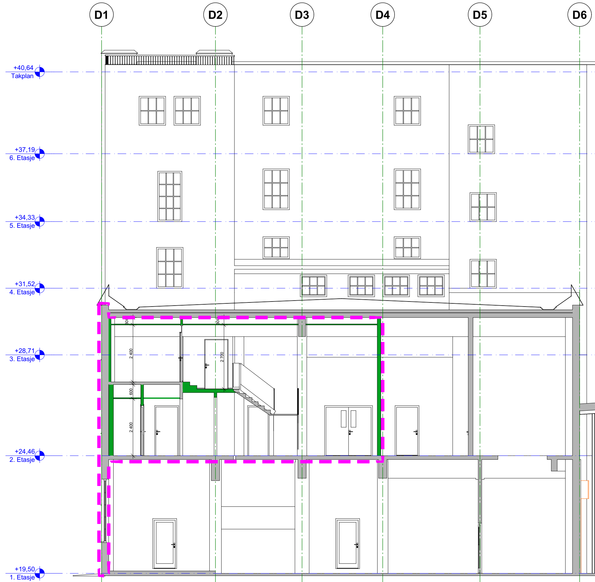
Snitt B 1:100