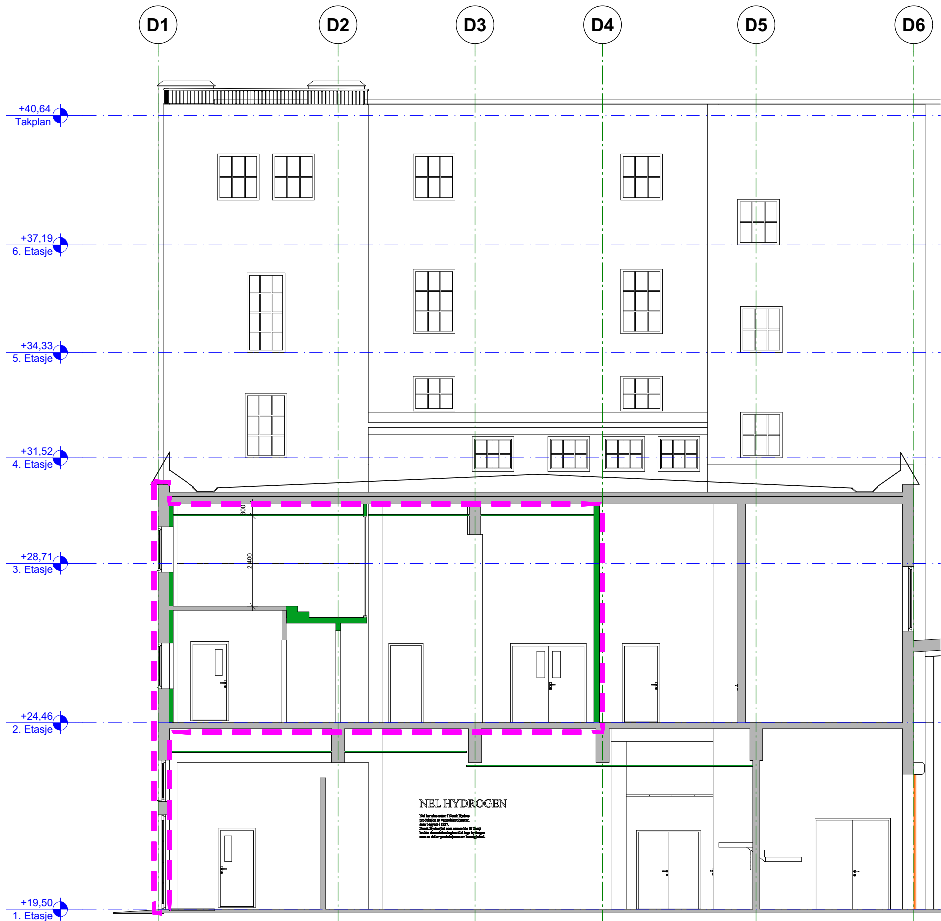
Snitt A 1:100