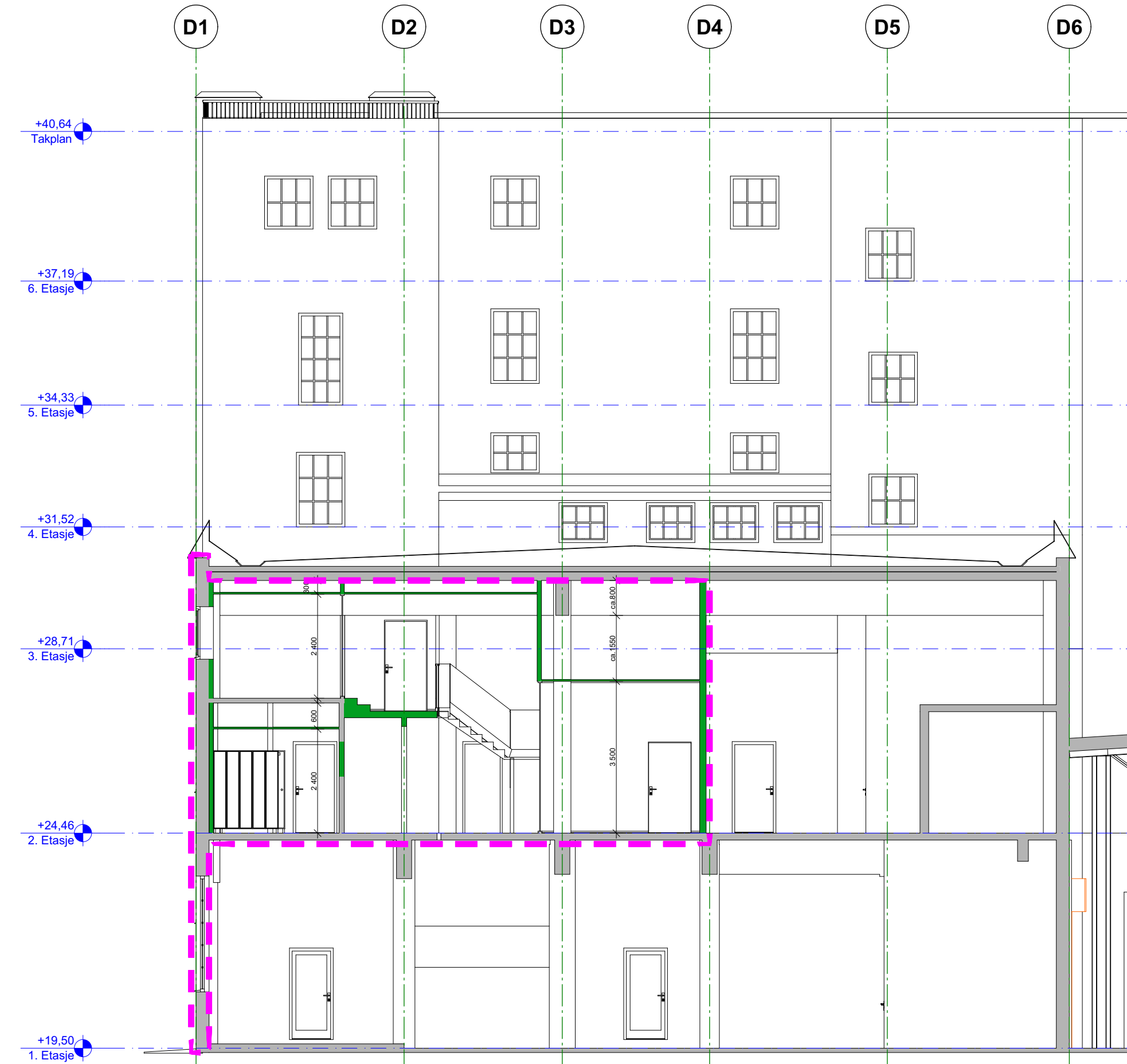
Snitt C 1:100